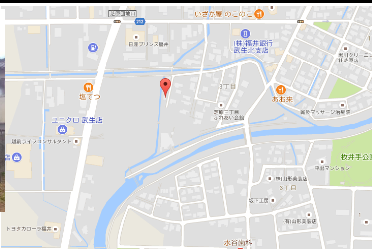
越前市芝原3丁目4-57 見取り図(要図)